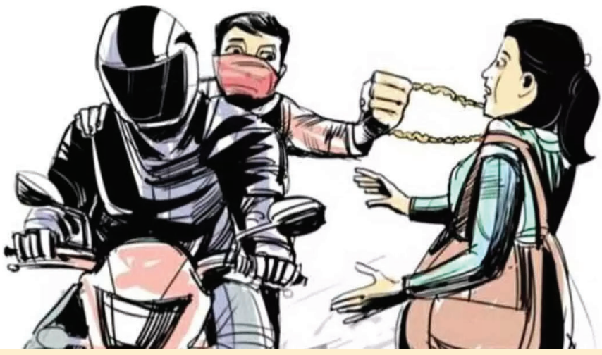
ఎల్సీనగర్, జనవరి 17 (భారత శక్తి): చాలా దొంగలు. మల్కాజ్గిరి కమిషనరేట్ పరిధిలో రోజూ తరువాత మళ్ళీ విజృంభిస్తున్న గొలుసు ఒక అర్థగంటలోపే రెండు స్టేషన్ల పరిధిలో