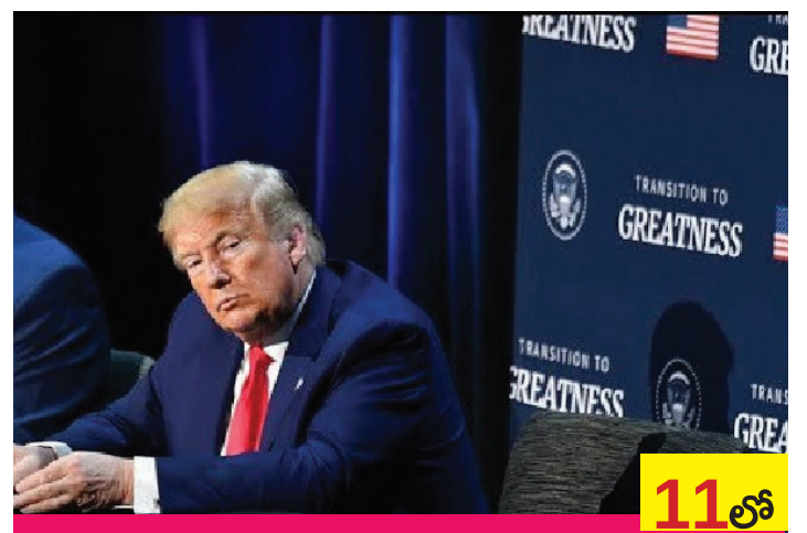
భారత్, పాకిస్థాన్లతో సంబంధాలపై అమెరికా రిపబ్లికన్ పార్టీ నేత కీలక వ్యాఖ్యలు

Published from Hyderabad, Kadapa, Guntur, Kurnool, Khammam, Vijayawada & Warangal